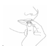
1 Abbildung 4

Entnehmen Sie die Schmelztablette mit trockenen Händen und legen Sie diese auf Ihre Zunge (Abbildung 4).