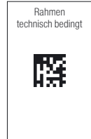
Rahmen technisch bedingt

Es werden möglicherweise nicht alle Packungsgrößen in den Verkehr gebracht.